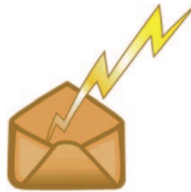
elektronische Kommunikation (eMail)

DoRIS hat die Fähigkeit, elektronisch ins Haus kommende Dokumente (eMails) mit Papierdokumenten (Briefe) in einem einheitlichen Posteingang zusammenzufassen. So präsentieren sich dem Nutzer die zu bearbeitenden Vorgänge einheitlich und übersichtlich. Effiziente Bearbeitung ist die Folge.