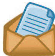
papiergebundene Kommunikation (Brief)